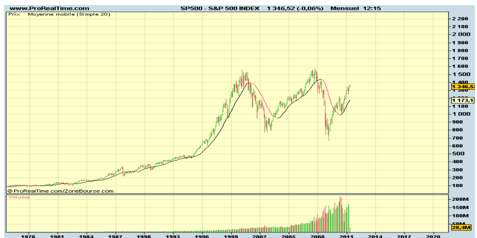
Indice Standard & Poor's des actions US